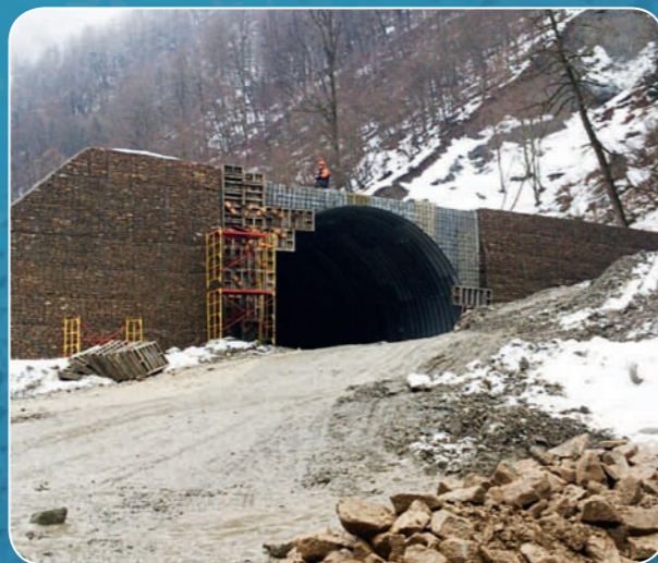
Арка из «супергофра» 12 x 6 м, селлавино- защитная галерея, Красная Поляна