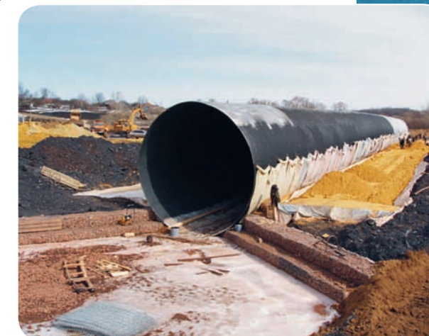
МГК круглая, диаметр 6 м, г. Белгород