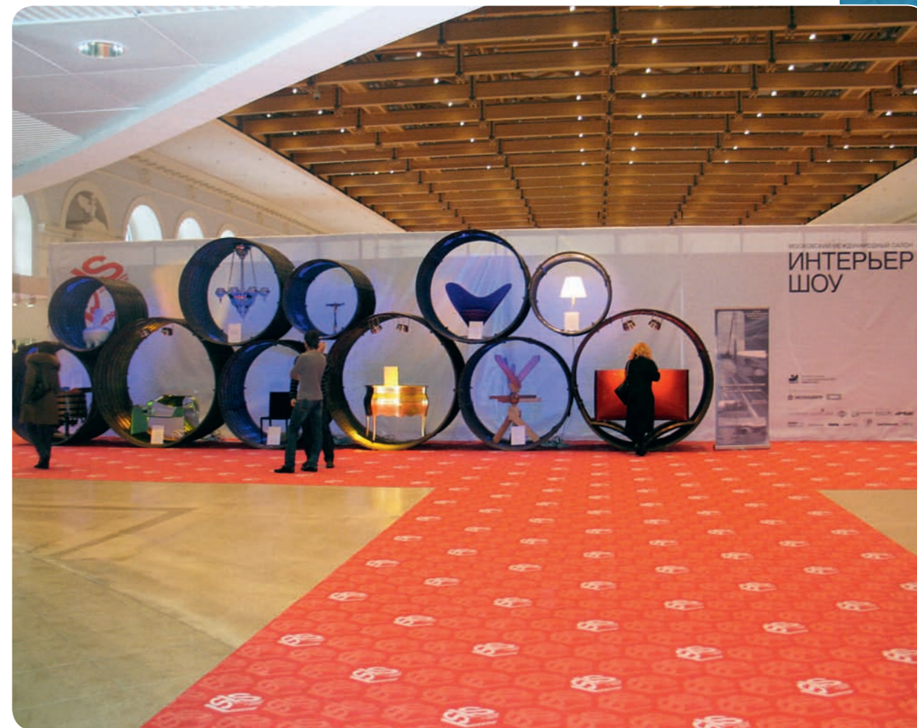
Выставка в гостином дворе «Интерьер Шоу». МГК в качестве элементов интерьера в «Музее интерьера»

открытое акционерное общество ГИДРОМОНТАЖ ОПЫТНЫЙ ЗАВОД ПРОМЫШЛЕННЫЙ ХОЛДИНГ