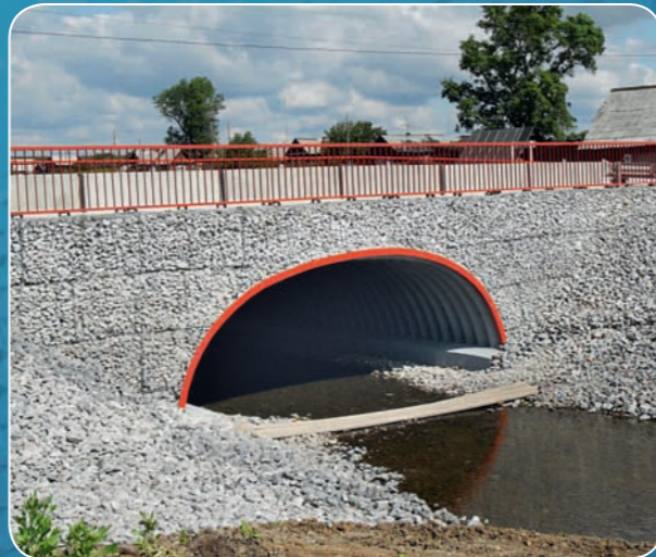
Арка из «супергофра», Свердловская область