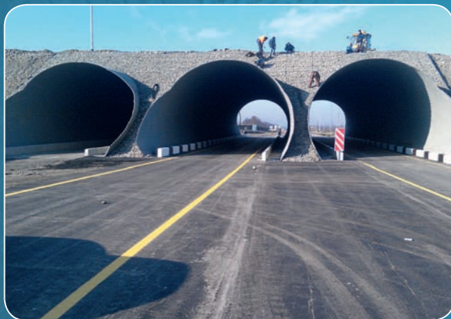
Транспортная развязка из МГК полицентрического сечения, обход г. Беслан