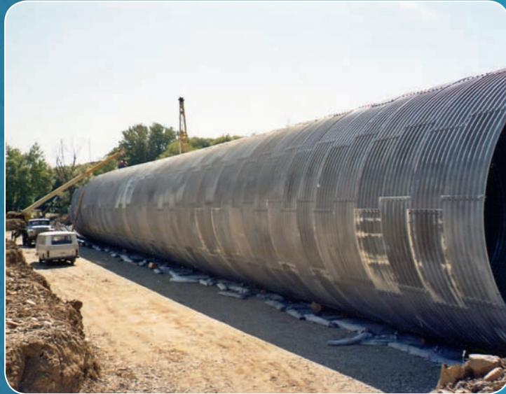
МГК круглого сечения, диаметр 6 м, г. Пятигорск