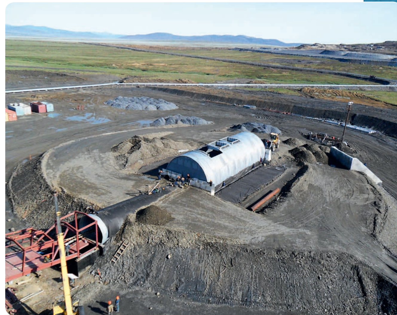
Строительство галереи для транспортировки руды, МГК диаметром 8 м, г. Певек, ЧАО

открытое акционерное общество ГИДРОМОНТАЖ ОПЫТНЫЙ ЗАВОД ПРОМЫШЛЕННЫЙ ХОЛДИНГ