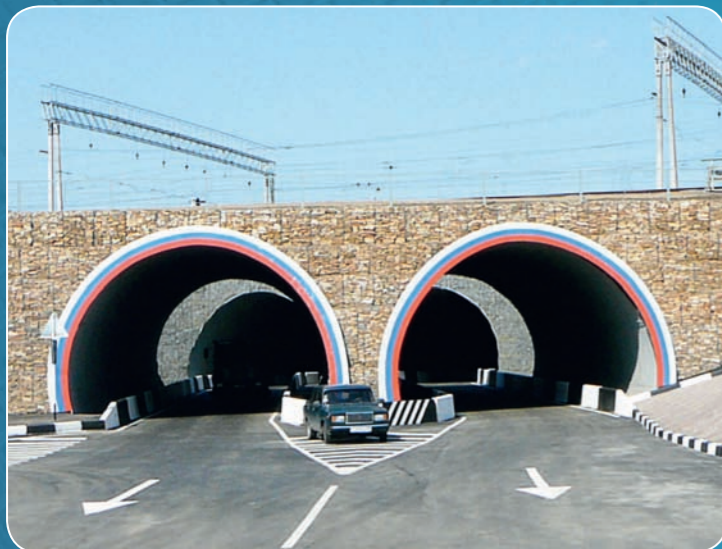
Замена путепровода на МГК полициентрического сечения, г. Курск