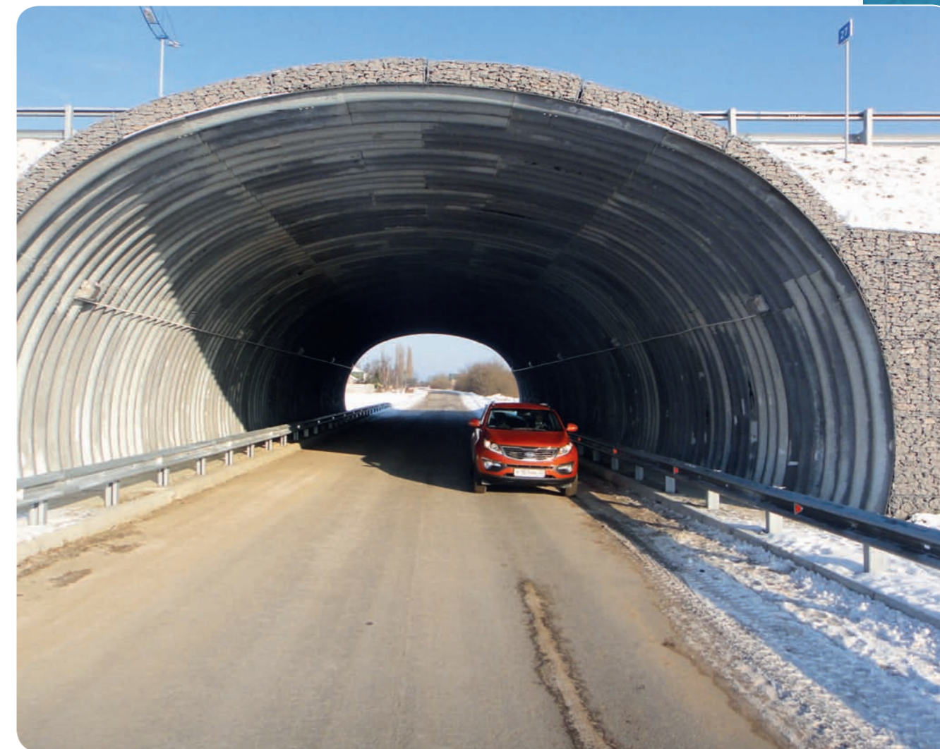
Арка из «супергофра» 12 x 6м на обходе г. Калининград

открытое акционерное общество ГИДРОМОНТАЖ ОПЫТНЫЙ ЗАВОД ПРОМЫШЛЕННЫЙ ХОЛДИНГ