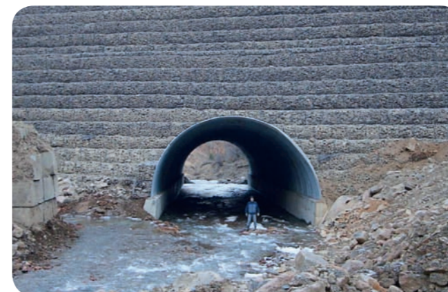
Арка из «супергофра» 12 x 6 м, КБР