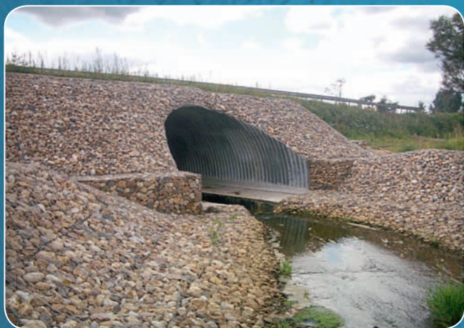
Арка 8 x 4 м, Московская область