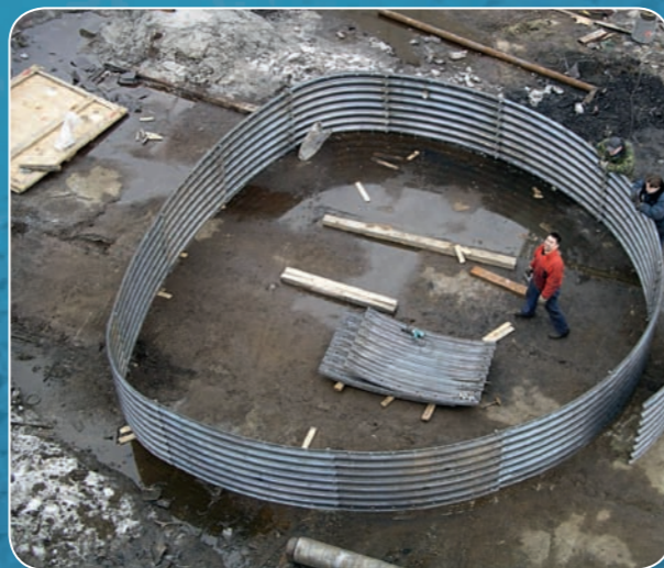
Контрольная сборка МГК поли- центрического сечения