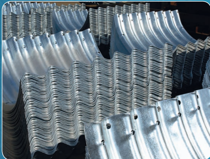
Готовая продукция на складе